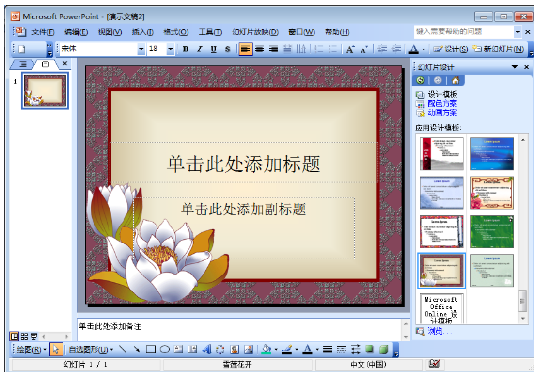
图 2 雪莲花开模板